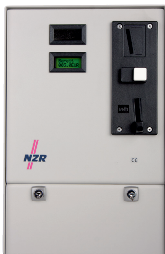
Abb. enthält eingebaute Option O